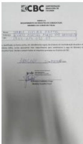
WhatsApp Image 2025-02-21 at 18.51.11.jpeg ~96 KB